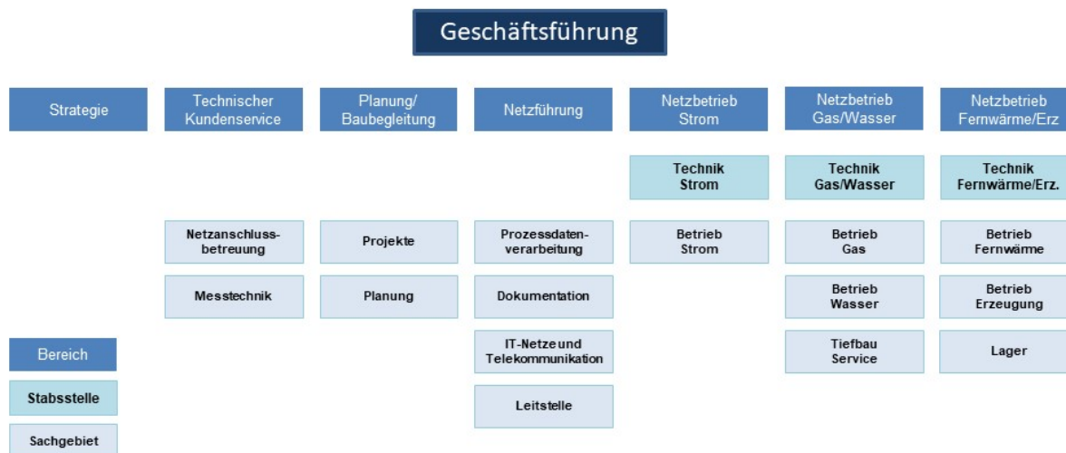
Abbildung 2 Organisation der Stadtwerke Jena Netze (Stand 31. Dezember 2021)

Die Aufgaben der Leitung und Letztentscheidung für die Stadtwerke Netze werden vollständig durch eigenes Personal erfüllt.